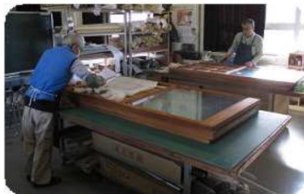
ふすま・障子の張替え作業

障子を張替えると柔らかな光に包まれて、部屋が明るくなります。本数や種類により異なりますが作業期間は 1 日～2 日で完成します。網戸の張替えも通常 8 本程度までは 1 日で完成です。ふすまの作業期間は通常 1 泊 2 日ほどかかります。